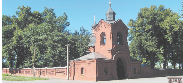
Усипальниця М.І. Пирогова

У південно-західній частині Вінниці є музей-садиба Миколи Івановича Пирогова — видатного лікаря і вченого, творця військово-польової хірургії, педагога і громадського діяча. Музейний комплекс набув світової слави, його відвідало більше 7 млн осіб з 169 країн світу. Нині він належить до найважливіших об'єктів культурної спадщини України і занесений до Державного реєстру пам'яток історії та архітектури національного значення. Його парк є також пам'яткою садово-паркового мистецтва. На головній алеї музею-садиби відновлено аптеку з інтер'єром та обладнанням пироговського часу. Воскові фігури відтворюють епізоди діяльності видатного лікаря на Поділлі. У музеї проходять виїзні сесії Академії медичних наук України, Пироговські читання, з'їзди, наукові конференції.